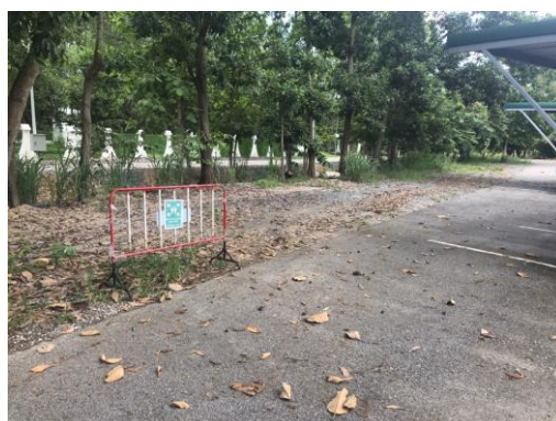
ภาพ จุดรวมพลสำรอง บริเวณลานจอดรถวิทยาลัยพลังงานทดแทน