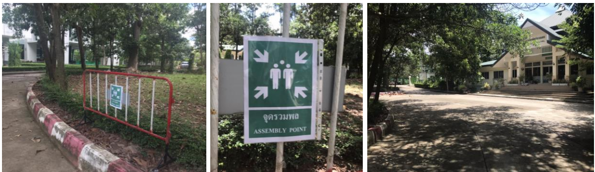
ภาพ จุดรวมพลหลัก บริเวณวงเวียนวิทยาลัยพลังงานทดแทน

ในเบื้องต้นวิทยาลัยพลังงานทดแทนได้กำหนดจุดรวมพลไว้ที่วงเวียนหน้าอาคารเรียนรวมและปฏิบัติการพลังงานทดแทน (อาคารA) วิทยาลัยพลังงานทดแทน และจุดรวมพลสำรองกำหนดไว้ที่ลานจอดรถวิทยาลัยพลังงานทดแทน อย่างไรก็ตามถ้ามีการเข้ามาฝึกอบรม ซ้อมดับเพลิงและอพยพหนีไฟ การตรวจสอบอุปกรณ์ดับเพลิงและสัญญาณเตือนภัย วิทยาลัยพลังงานทดแทนจะขอข้อเสนอแนะจาก ส่วนงานงานป้องกันและบรรเทาสาธารณภัยเทศบาลเมืองแม่โจ้ อีกครั้ง