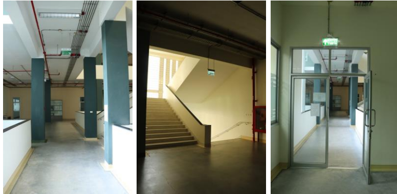
ภาพ ป้ายทางหนีไฟ

วิทยาลัยพลังงานทดแทนได้มีการกำหนดทางออกฉุกเฉิน ทางหนีไฟ และมีป้ายแสดงอย่างชัดเจนทุกชั้นของอาคาร