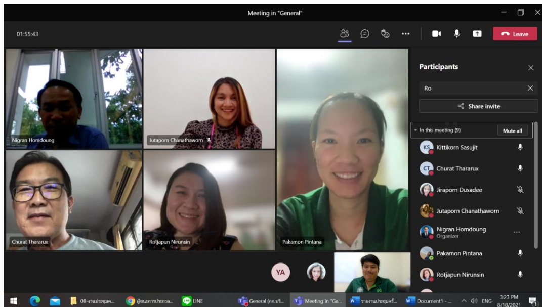
การประชุมผ่านระบบ Conference