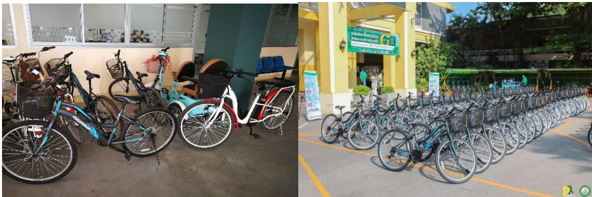
จักรยานสำหรับการใช้งานเดินทางในพื้นที่

มหาวิทยาลัยให้การสนับสนุนจักรยานให้แก่แต่ละหน่วยงาน จำนวนหน่วยงานละ 2 คัน เพื่อสนับสนุนให้บุคลากรใช้รถจักรยานในการเดินทางติดต่อราชการภายในมหาวิทยาลัย และส่งเสริมให้บุคลากรที่พักในมหาวิทยาลัยใช้จักรยานในการเดินทางมาทำงาน นอกจากนี้วิทยาลัยพลังงานทดแทน มีรถจักรยานไฟฟ้า จำนวน 3 คัน สำหรับการเดินทางไปยังอาคารต่าง ๆ ในพื้นที่