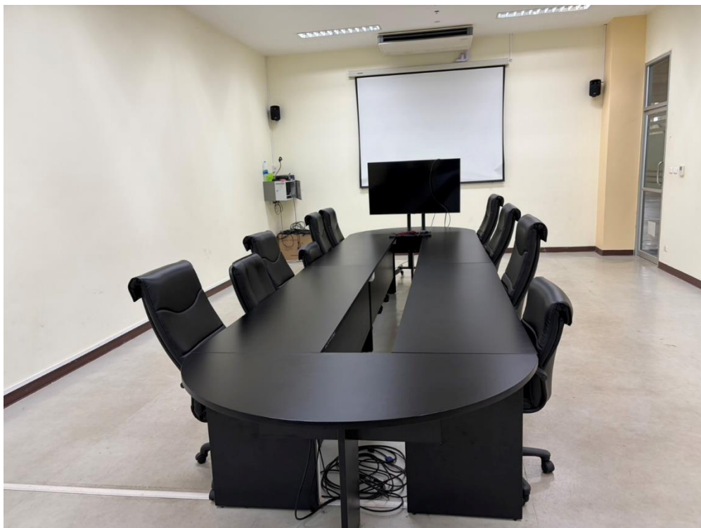
ภาพพื้นที่สำรองในการทำงานของบุคลากร